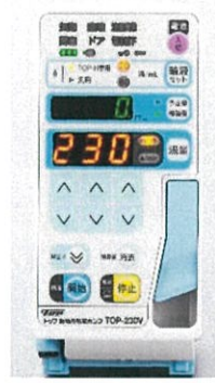
変更点は本体外観のみ