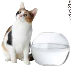
金魚鉢のような器が好きな子も。

猫は喉が渇いても近くに水がなければがまんをしてしまいます。「飲みたい」と思った時にすぐ飲めるように水入れは家の中のいろんな場所に置いておきましょう。また、新鮮な水を好むため、こまめに入れ替えてあげましょう。水道の近くに置くのもおすすめです。