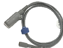
プローブ 延長コード (1.5m)