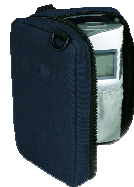
キャリングケース