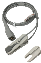
プローブ & クリップ